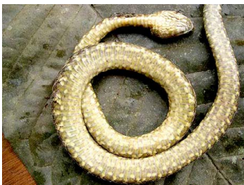
133 Bothrops atrox VIPERIDAE