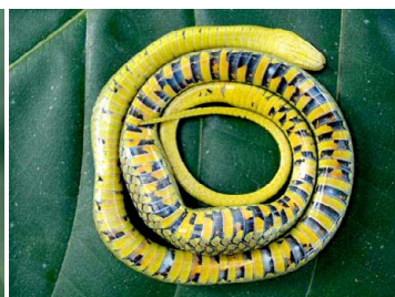
55 Liophis reginae COLUBRIDAE