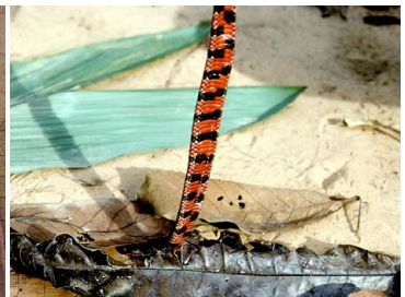
88 Helicops angulatus COLUBRIDAE