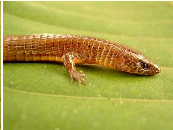
42 Ptychoglossus brevifrontalis GYMNOPHTHALMIDAE