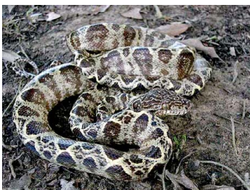
117 Corallus hortulanus BOIDAE