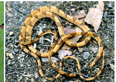
68 Imantodes lentiferus (Brasil) COLUBRIDAE