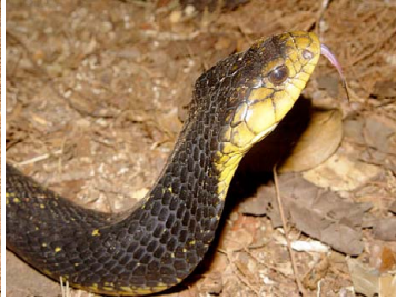
102 Xenodon severus COLUBRIDAE