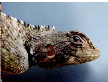
7 Plica umbra TROPIDURIDAE