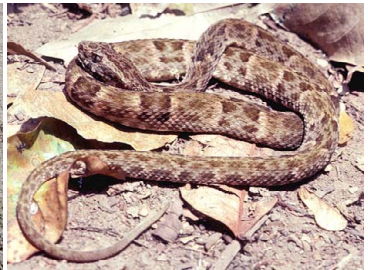
132 Bothrops atrox VIPERIDAE