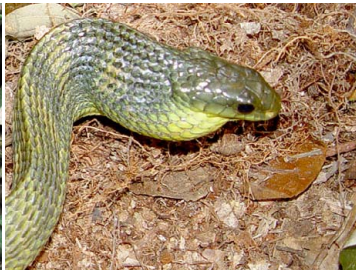
106 Pseustes sulphureus COLUBRIDAE