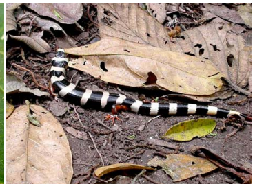
48 Diploglossus fasciatus ANGUIDAE