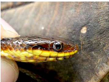
73 Liophis sp. COLUBRIDAE