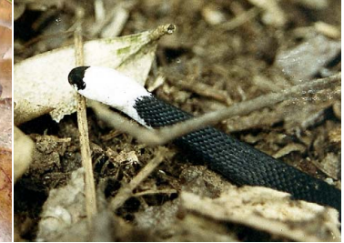
64 Ninia hudsoni COLUBRIDAE