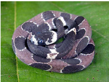
65 Dipsas catesbyi COLUBRIDAE