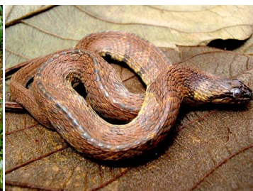
139 Helicops angulatus COLUBRIDAE