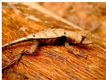
9 Stenocercus fimbriatus TROPIDURIDAE