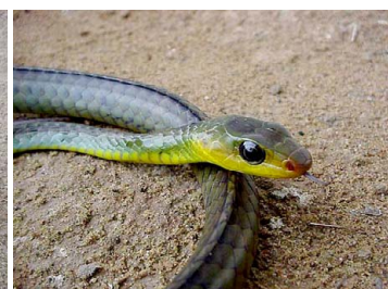
79 Chironius cf. multiventris COLUBRIDAE