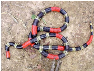
126 Micrurus lemniscatus ELAPIDAE