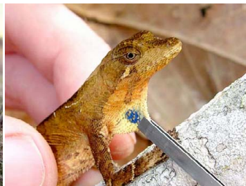
31 Anolis nitens (hembra) POLYCHROTIDAE