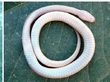
71 Xenopholis scalaris COLUBRIDAE