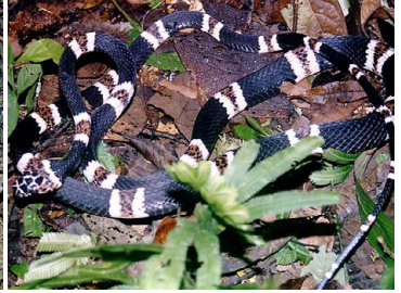
104 Rhinobothryum lentiginosum COLUBRIDAE