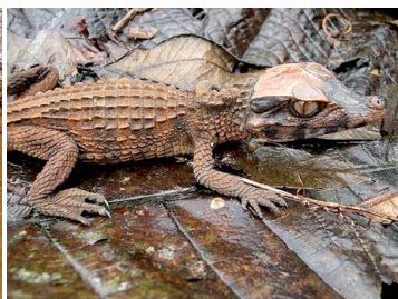
160 Paleosuchus trigonatus ALLIGATORIDAE