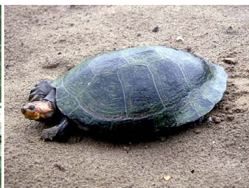
152 Podocnemis unifilis PELOMEDUSIDAE