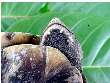
146 Mesoclemmys gibba CHELIDAE