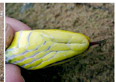
80 Chironius cf. multiventris COLUBRIDAE