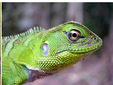
15 Enyalioides laticeps HOPLOCERCIDAE