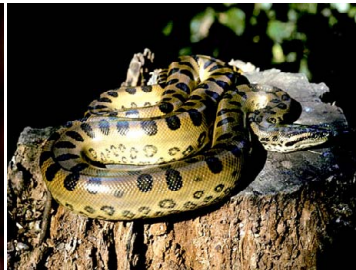
111 Eunectes murinus BOIDAE