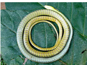
77 Chironius fuscus COLUBRIDAE