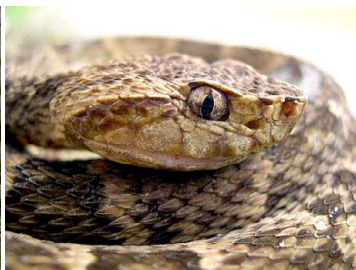
134 Bothrops atrox VIPERIDAE