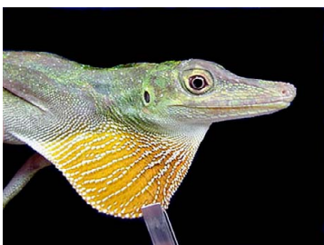
33 Anolis punctatus (macho) POLYCHROTIDAE