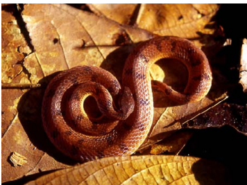
69 Xenopholis scalaris COLUBRIDAE