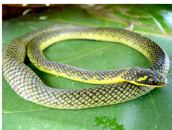
53 Liophis reginae COLUBRIDAE