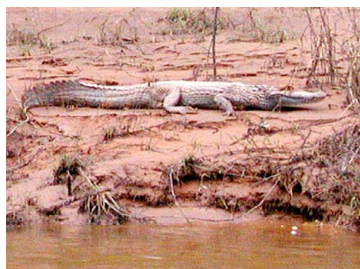
157 Caiman crocodilus ALLIGATORIDAE