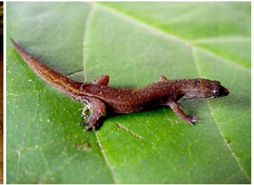
24 Pseudogonatodes guianensis GEKKONIDAE