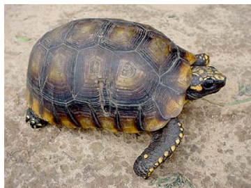
153 Geochelone denticulata TESTUDINIDAE