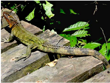
21 Dracaena guianensis TEIIDAE