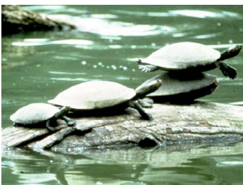
151 Podocnemis unifilis PELOMEDUSIDAE