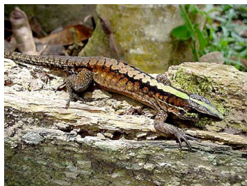
17 Kentropyx pelviceps TEIIDAE