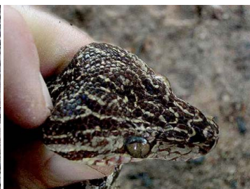
118 Corallus hortulanus BOIDAE