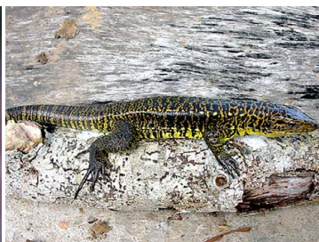
16 Tupinambis teguixin TEIIDAE