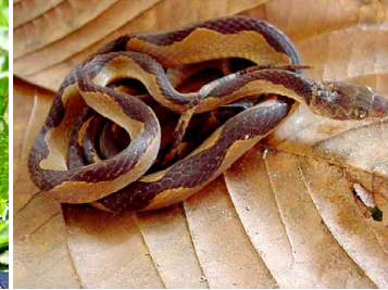
63 Leptodeira annulata COLUBRIDAE