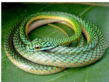
49 Leptophis ahaetulla COLUBRIDAE