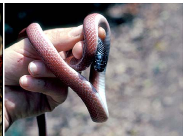
100 Pseudoboa coronata COLUBRIDAE