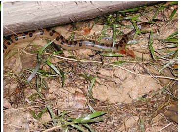
112 Eunectes murinus BOIDAE