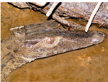
159 Paleosuchus trigonatus ALLIGATORIDAE