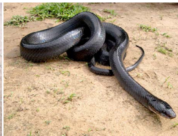
91 Clelia clelia COLUBRIDAE