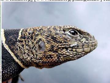
3 Uracentron flaviceps TROPIDURIDAE