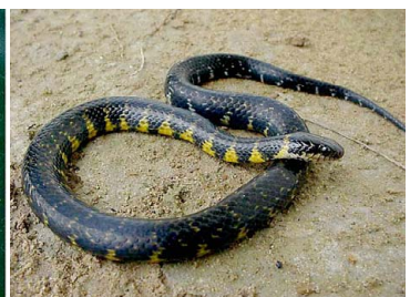
56 Liophis taeniogaster COLUBRIDAE