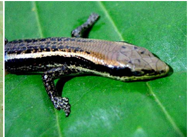
44 Mabuya nigropunctata SCINCIDAE