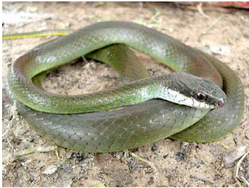
81 Drymoluber dichrous COLUBRIDAE