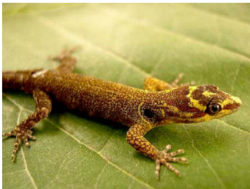
25 Gonatodes humeralis (macho) GEKKONIDAE