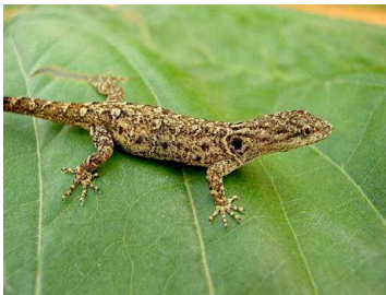
26 Gonatodes humeralis (hembra) GEKKONIDAE