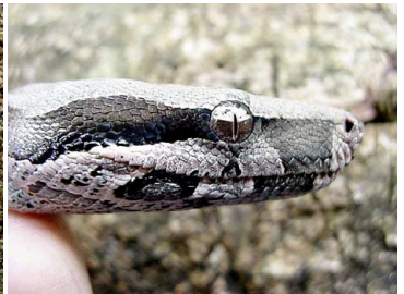
108 Boa constrictor BOIDAE