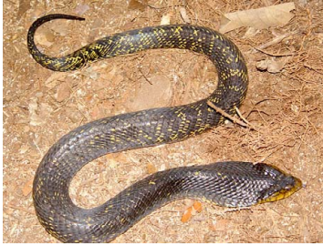
101 Xenodon severus COLUBRIDAE