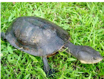
147 Phrynops cf. raniceps CHELIDAE