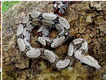
107 Boa constrictor BOIDAE