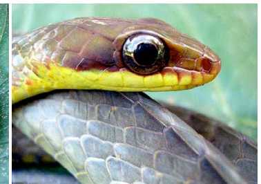
76 Chironius fuscus COLUBRIDAE