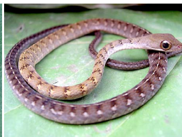
51 Dendrophidion dendrophis COLUBRIDAE