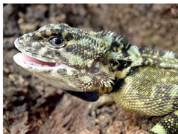
5 Plica plica TROPIDURIDAE