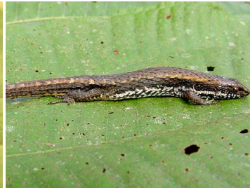
43 Alopoglossus angulatus (foto JMJ) GYMNOPHTHALMIDAE