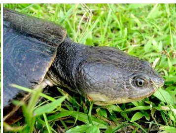
148 Phrynops cf. raniceps CHELIDAE