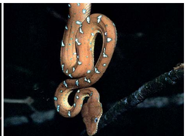
116 Corallus caninus (Brasil) BOIDAE