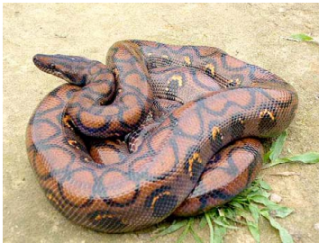
109 Epicrates cenchria BOIDAE