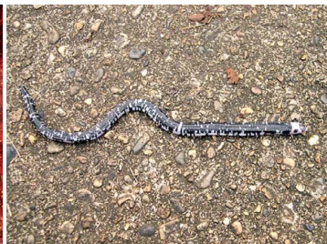
46 Amphisbaena fuliginosa AMPHISBAENIDAE