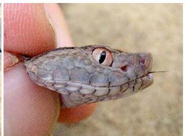
136 Bothrops cf. brazili (juv.) VIPERIDAE