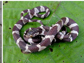
67 Imantodes cenchoa COLUBRIDAE