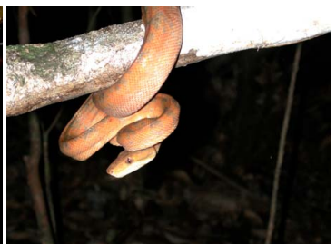
120 Corallus hortulanus (French Guyana) BOIDAE