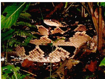
137 Lachesis muta VIPERIDAE