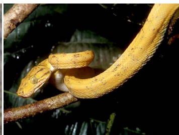
119 Corallus hortulanus BOIDAE