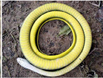
83 Drymoluber dichrous COLUBRIDAE