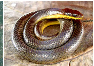
72 Liophis sp. COLUBRIDAE