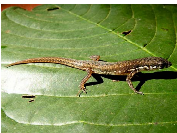
37 Cercosaura eigenmanni GYMNOPHTHALMIDAE