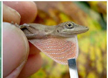
28 Anolis fuscoauratus (macho) POLYCHROTIDAE