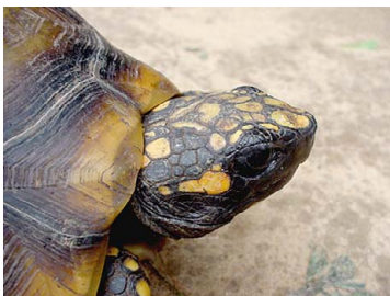
154 Geochelone denticulata TESTUDINIDAE