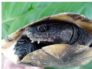
145 Mesoclemmys gibba CHELIDAE