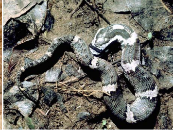
103 Xenodon severus (juv.) COLUBRIDAE