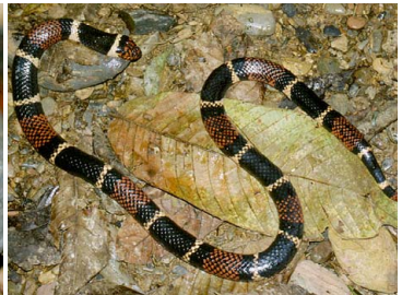
128 Micrurus surinamensis ELAPIDAE