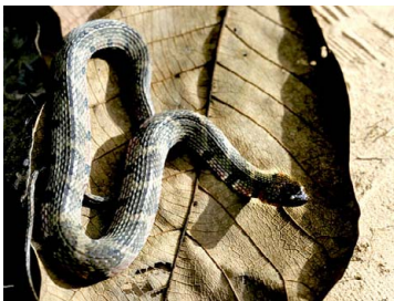
85 Helicops angulatus COLUBRIDAE