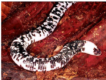
45 Amphisbaena fuliginosa AMPHISBAENIDAE