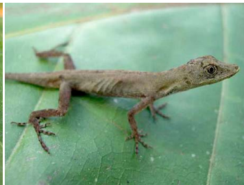
27 Anolis fuscoauratus POLYCHROTIDAE