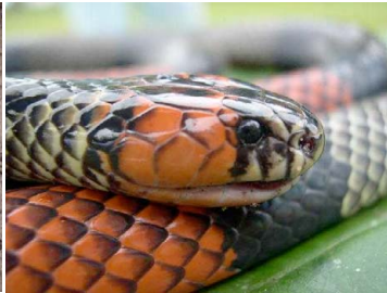
122 Micrurus obscurus ELAPIDAE