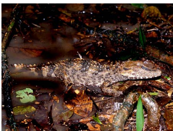
158 Paleosuchus trigonatus ALLIGATORIDAE