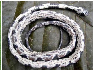
66 Dipsas catesbyi COLUBRIDAE