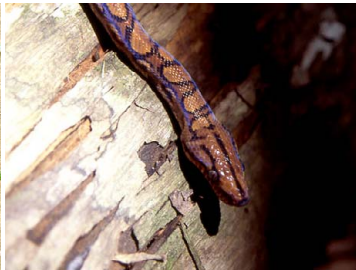
110 Epicrates cenchria BOIDAE