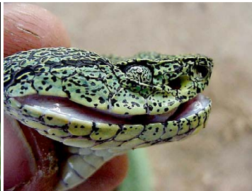
130 Bothriopsis bilineata (adulto) VIPERIDAE