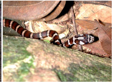
84 Drymoluber dichrous (juv.) COLUBRIDAE