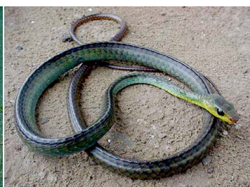
78 Chironius cf. multiventris (foto RVM) COLUBRIDAE