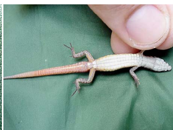
39 Cercosaura eigenmanni GYMNOPHTHALMIDAE