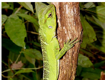
14 Enyalioides laticeps HOPLOCERCIDAE