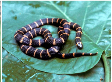
124 Micrurus annellatus ELAPIDAE