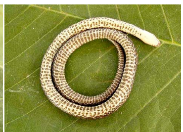
60 Atractus sp. COLUBRIDAE