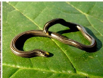
47 Leptotyphlops cf. diaplocius LEPTOTYPHLOPIDAE