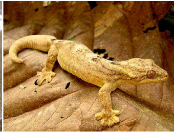
23 Thecadactylus rapicauda GEKKONIDAE