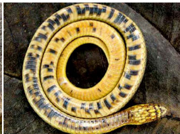
74 Liophis sp. COLUBRIDAE