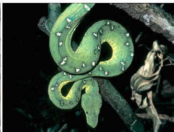
114 Corallus caninus BOIDAE