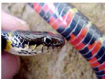
57 Liophis taeniogaster COLUBRIDAE