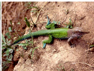
20 Ameiva ameiva (macho) TEIIDAE