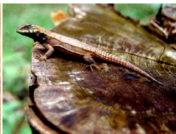
10 Stenocercus roseiventris TROPIDURIDAE