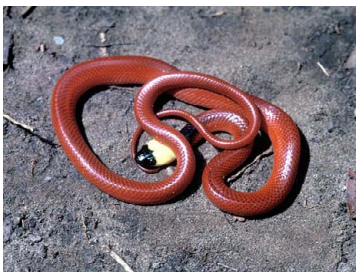
93 Clelia clelia (juv.) COLUBRIDAE