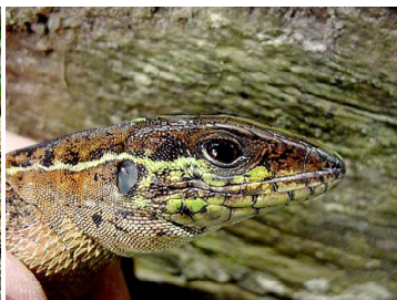
18 Kentropyx pelviceps TEIIDAE