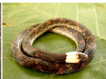
59 Atractus sp. COLUBRIDAE