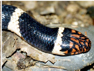
127 Micrurus surinamensis ELAPIDAE