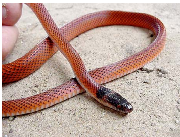
97 Oxyrhopus melanogenys COLUBRIDAE