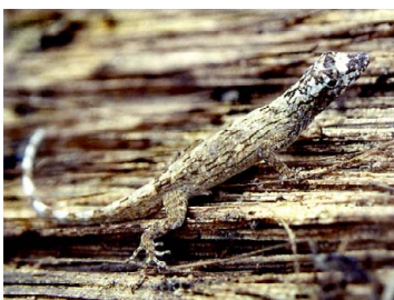
34 Anolis ortonii POLYCHROTIDAE