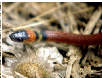
99 Oxyrhopus cf. melanogenys (juv.) - COLUBRIDAE