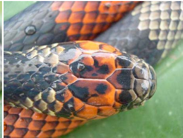
123 Micrurus obscurus ELAPIDAE