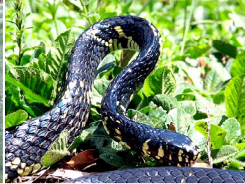
62 Spilotes pullatus COLUBRIDAE