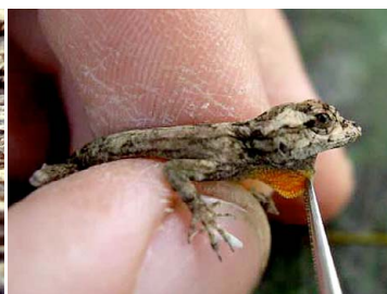
35 Anolis ortonii (macho) POLYCHROTIDAE