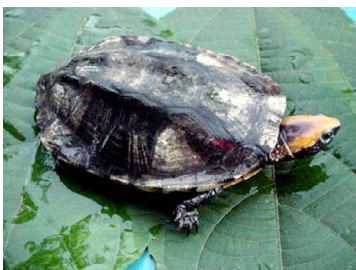
150 Platemyis platycephala CHELIDAE