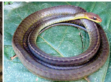
75 Chironius fuscus COLUBRIDAE