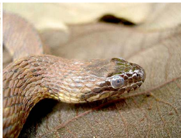
86 Helicops angulatus COLUBRIDAE