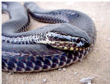
90 Pseudoeryx plicatilis COLUBRIDAE