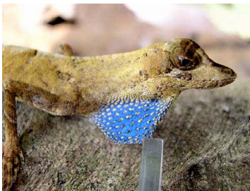
30 Anolis nitens (macho) POLYCHROTIDAE