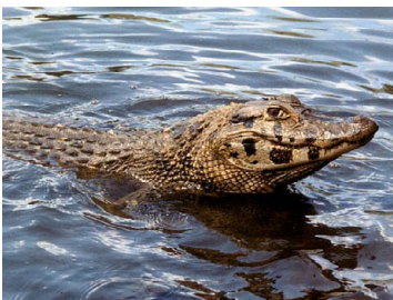
155 Melanosuchus niger ALLIGATORIDAE