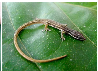
40 Cercosaura argulus GYMNOPHTHALMIDAE