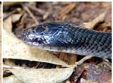
92 Clelia clelia COLUBRIDAE