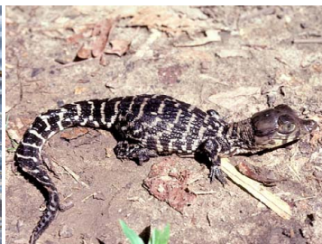
156 Melanosuchus niger (juvenil) ALLIGATORIDAE