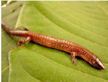
41 Ptychoglossus brevifrontalis GYMNOPHTHALMIDAE