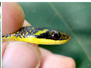
54 Liophis reginae COLUBRIDAE