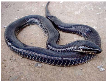
89 Pseudoeryx plicatilis COLUBRIDAE