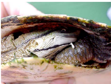
142 Phrynops tuberosus CHELIDAE