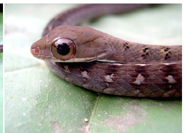
52 Dendrophidion dendrophis COLUBRIDAE