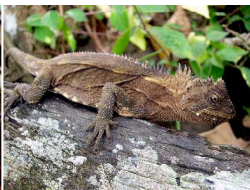
11 Enyalioides palpebralis HOPLOCERCIDAE