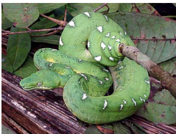
113 Corallus caninus BOIDAE