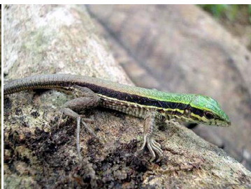
19 Ameiva ameiva TEIIDAE