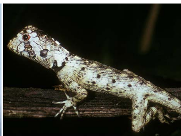
8 Plica sp. (juvenile) TROPIDURIDAE