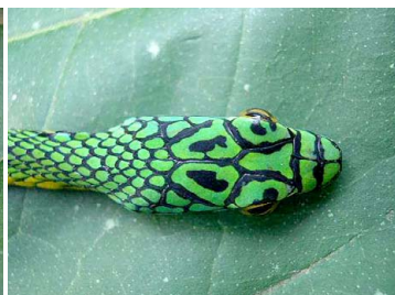
50 Leptophis ahaetulla COLUBRIDAE