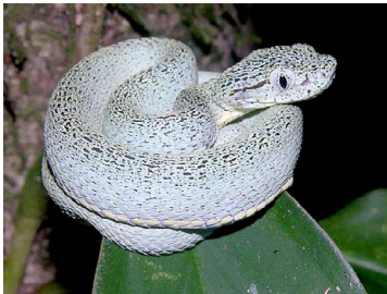
129 Bothriopsis bilineata (juvenil) VIPERIDAE