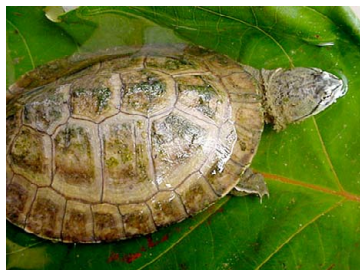
141 Phrynops tuberosus CHELIDAE