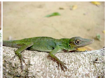
32 Anolis punctatus POLYCHROTIDAE