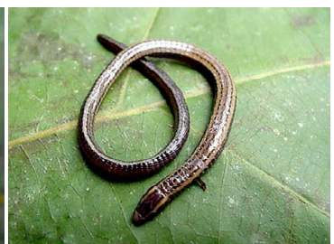
36 Bachia dorbignyi GYMNOPHTHALMIDAE