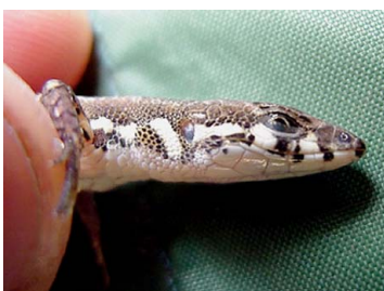
38 Cercosaura eigenmanni GYMNOPHTHALMIDAE