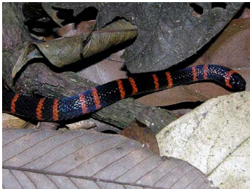
125 Micrurus cf. annellatus (foto PC) ELAPIDAE