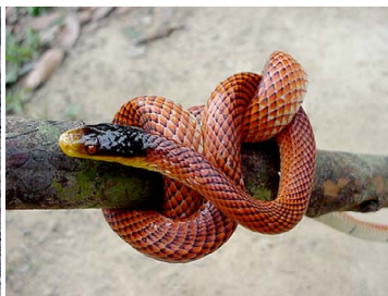
94 Oxyrhopus formosus COLUBRIDAE