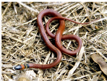
98 Oxyrhopus cf. melanogenys (juv.) - COLUBRIDAE