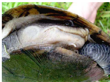
149 Phrynops cf. raniceps CHELIDAE