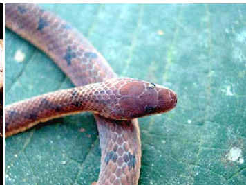
70 Xenopholis scalaris COLUBRIDAE