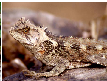
12 Enyalioides palpebralis HOPLOCERCIDAE