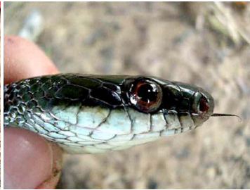
82 Drymoluber dichrous COLUBRIDAE