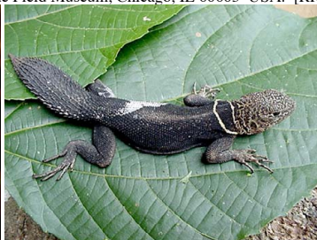
2 Uracentron flaviceps TROPIDURIDAE