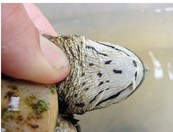
143 Phrynops tuberosus CHELIDAE