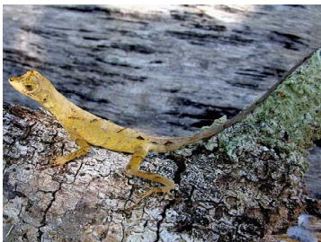
29 Anolis nitens POLYCHROTIDAE