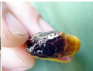
95 Oxyrhopus formosus COLUBRIDAE