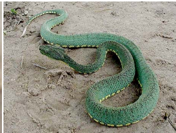
131 Bothriopsis bilineata VIPERIDAE