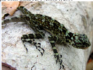
4 Plica plica TROPIDURIDAE