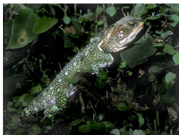
13 Enyalioides laticeps HOPLOCERCIDAE