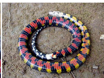
58 Liophis taeniogaster COLUBRIDAE