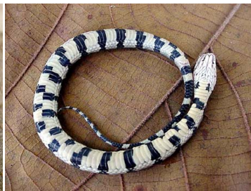
87 Helicops angulatus COLUBRIDAE