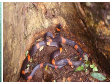
96 Oxyrhopus cf. petola COLUBRIDAE