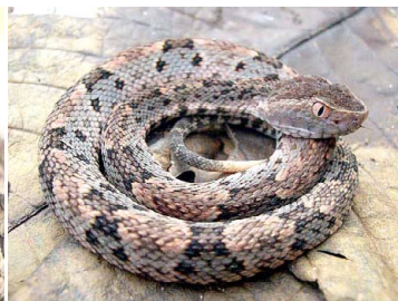
135 Bothrops cf. brazili (juv.) VIPERIDAE