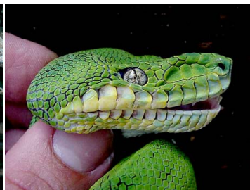
115 Corallus caninus BOIDAE