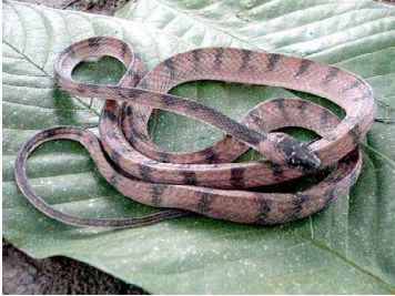
61 Siphlophis compressus COLUBRIDAE