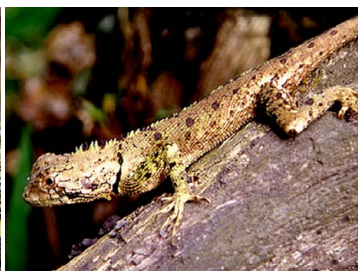
6 Plica umbra TROPIDURIDAE