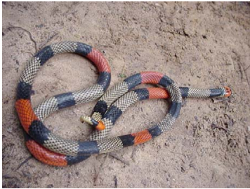
121 Micrurus obscurus ELAPIDAE