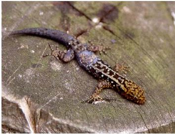
22 Gonatodes hasemani GEKKONIDAE