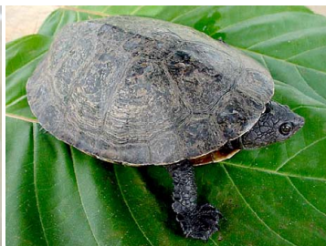
144 Mesoclemmys gibba CHELIDAE