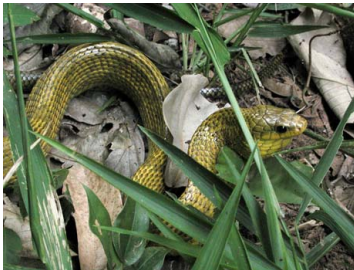
105 Pseustes sulphureus COLUBRIDAE