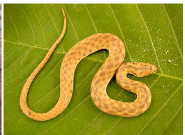
140 Helicops cf. leopardinus COLUBRIDAE