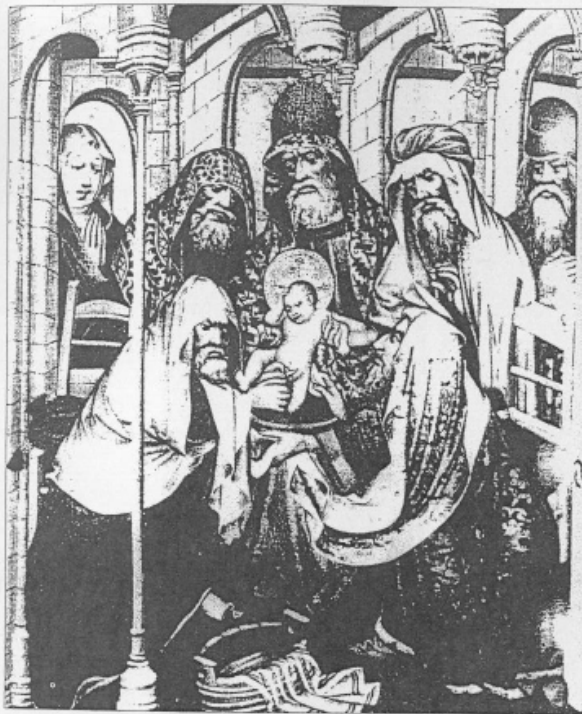
18. Circoncisione di Cristo, Salisburgo, 1440 ca. (da H. Schreckenberg, The Jesus in Christian Art , Göttingen, 1996, p. 144).