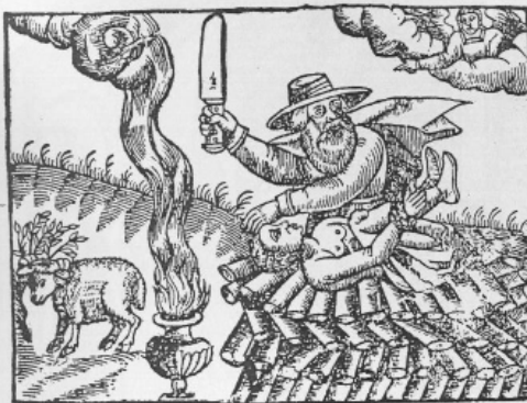
15. Sacrificio di Isacco , xilografia dai Responsi Rinali ( Sbeelot u-teshuvo ) di Asher b. Yechiel, Costantinopoli, s.c., 1517.