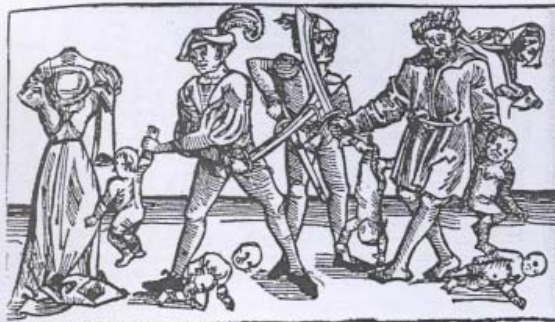
3. La strage degli innocenti , xilografia dall' Utraquitz Passional , Praga, Jan Camp, 1495.