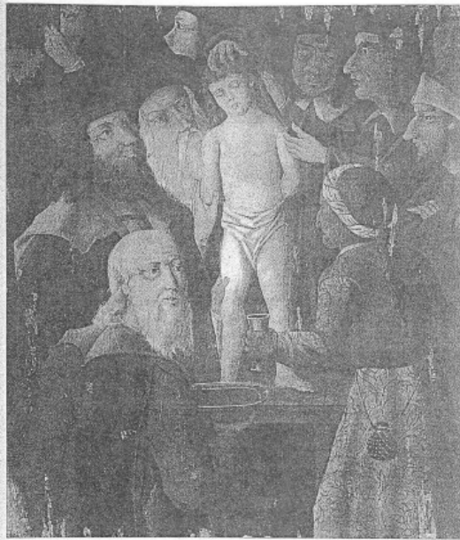
21. Scuola altoatesina, Martirio di Simontino , prima metà XVI sec., Trento, Museo provinciale d'arte.