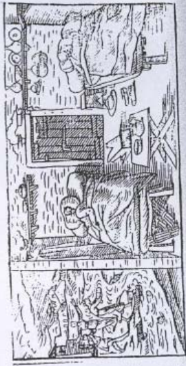
9. I borghesi affogati nel Nido, xilografia della Fratellanza di Pasqua, Mantova, Giacomo Ruffinelli, 1960.