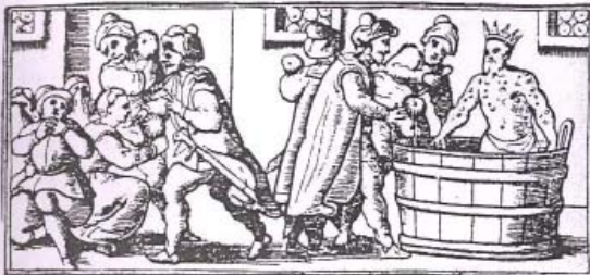
ליחט טון סאגנדי פיר דעם ליפורה געטרובן. פיר פנה ל' אקרה טיקנירטי און סאגנדי צו דעם ליגו 6. Il bagno di sangue del faraone , xilografia dalla Haggadah di Pasqua , Venezia, Giovanni De Gara, 1609.