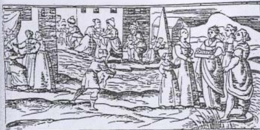
11. I bambini affogati nel Nilo , xilografia dalla Haggadah di Pasqua, Venezia, Giovanni De Gara, 1609.