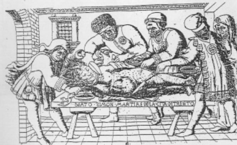
16. Martirio di Simonino ed ebrei con gli occhiali , incisione su legno, Italia settentrionale 1475-85 (da A.M. Hind, Early Italian Engraving , II, New York - London, 1938, tav. 74).