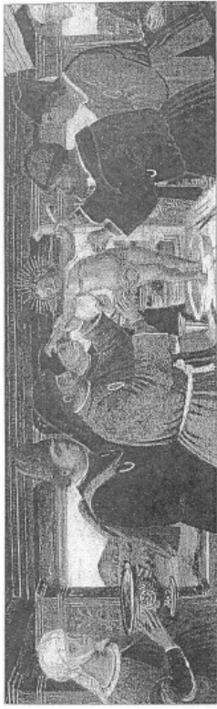
20. Candellino da Rocco d'Azzi, Martirio di Simovino , tempera su tavola, fine XV sec., Gerusalemme, Museo Israel.