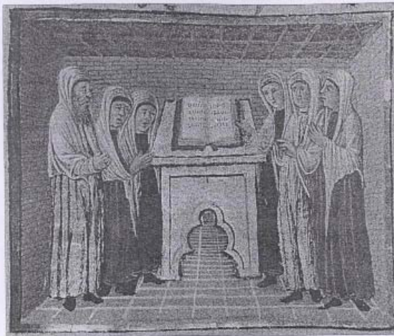
22. Unatorio degli ebrei tedeschi con l'«almemora» , miniatura dalla Miscellanea Rothschild , Venezia (?), 1475, Gerusalemme, Museo Bezalel.