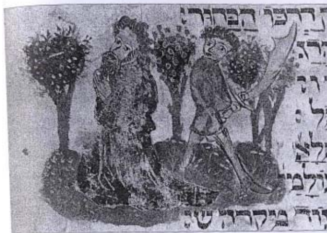
Ebreo tedesco giustiziato con la spada, miniatura dal codice ebraico 37 della Biblioteca di Stato e Universitaria di Amburgo (c. 79r).