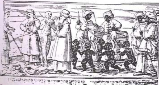
קי סיריק אהר ד' יעניי אי קרדיי אה טני אקמדי 7. Incantatori e negromanti , xilografia dalla Haggadah di Pasqua , Venezia, Giovanni De Gara, 1609.