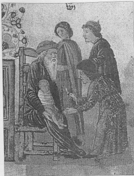
17. Circumcisione , miniatura dalla Miscellanea Rothschild, Venezia (?), 1475, Gerusalemme, Museo Bezalel.