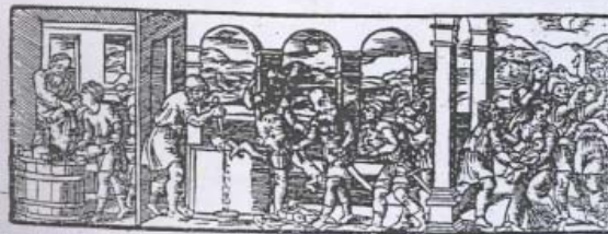
4. Il bagno di sangue del faraone , xilografia dalla Haggadah di Pasqua , Martova, Giacomo Rufinelli, 1560.