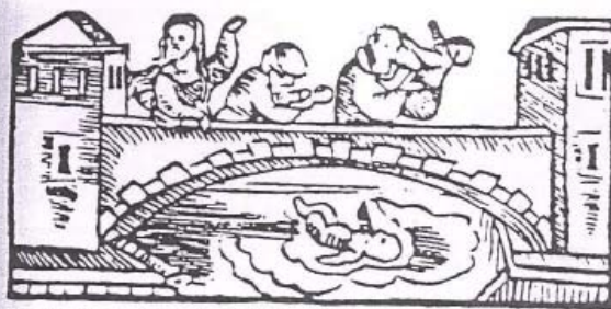
8. I bambini affogati nel Nilo , xilografia dalla Haggadah di Pasqua, Praga , Gershom Cohen, 1526.