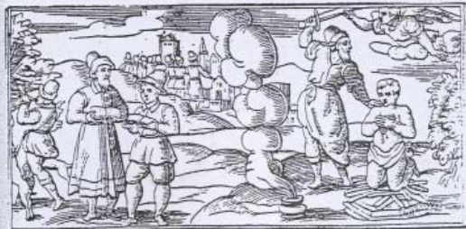
12. Sacrificio di Isacco , xilografia dalla Haggadah di Pasqua, Venezia, Giovanni De Gara, 1609.