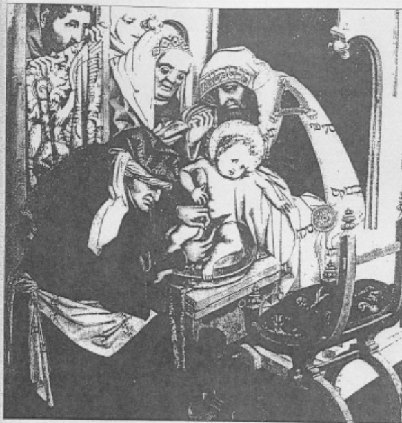
19. Circoncisione di Cristo , pittura d'altare, 1450 ca., Norimberga, Liebfrauenkirche.