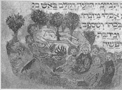
14. Ebreo tedesco torturato con il fuoco , miniatura dal codice ebraico 37 della Biblioteca di Stato e Universitaria di Amburgo (c. 79r).